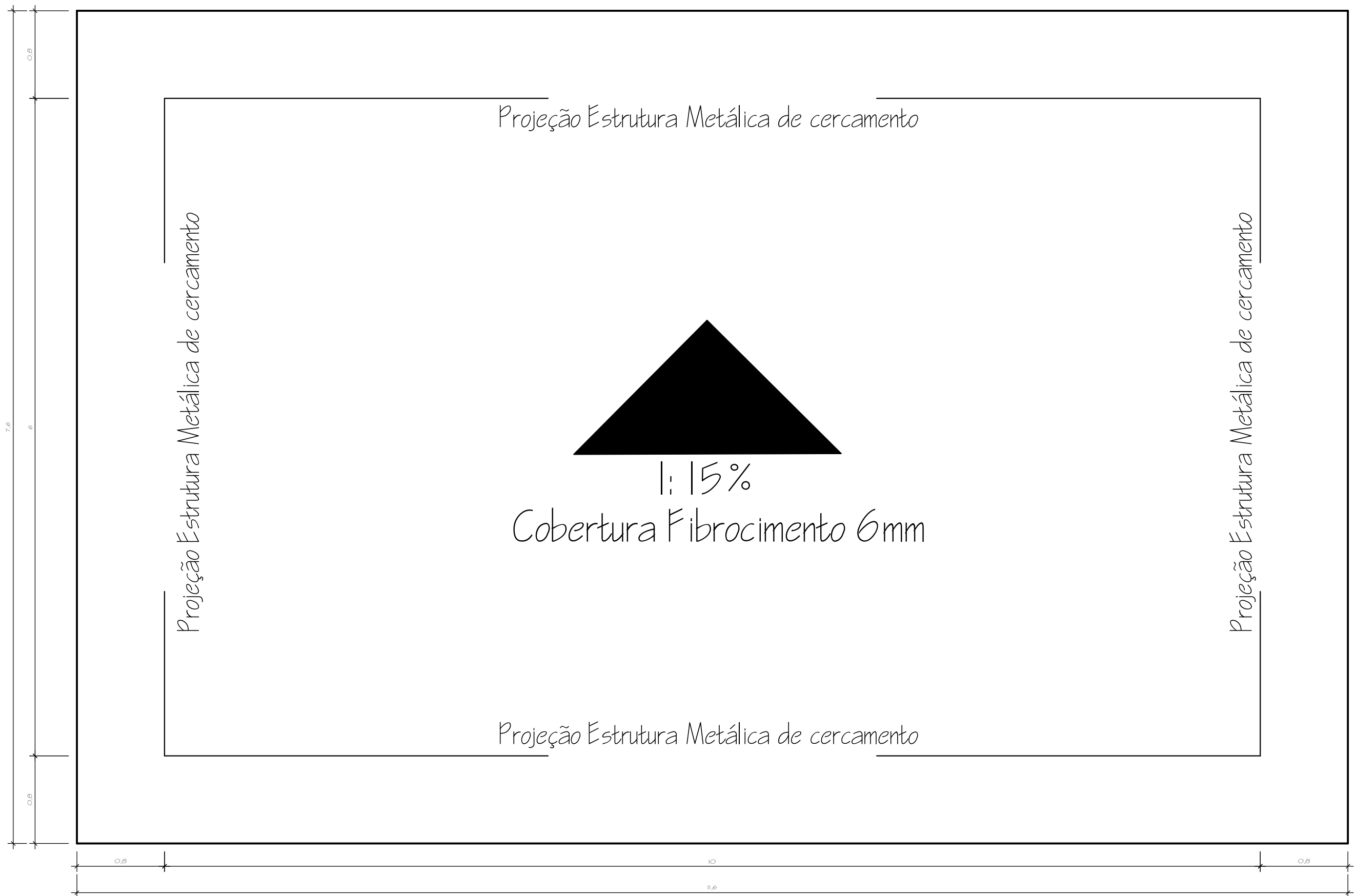
COBERTURA Esc: 1:50