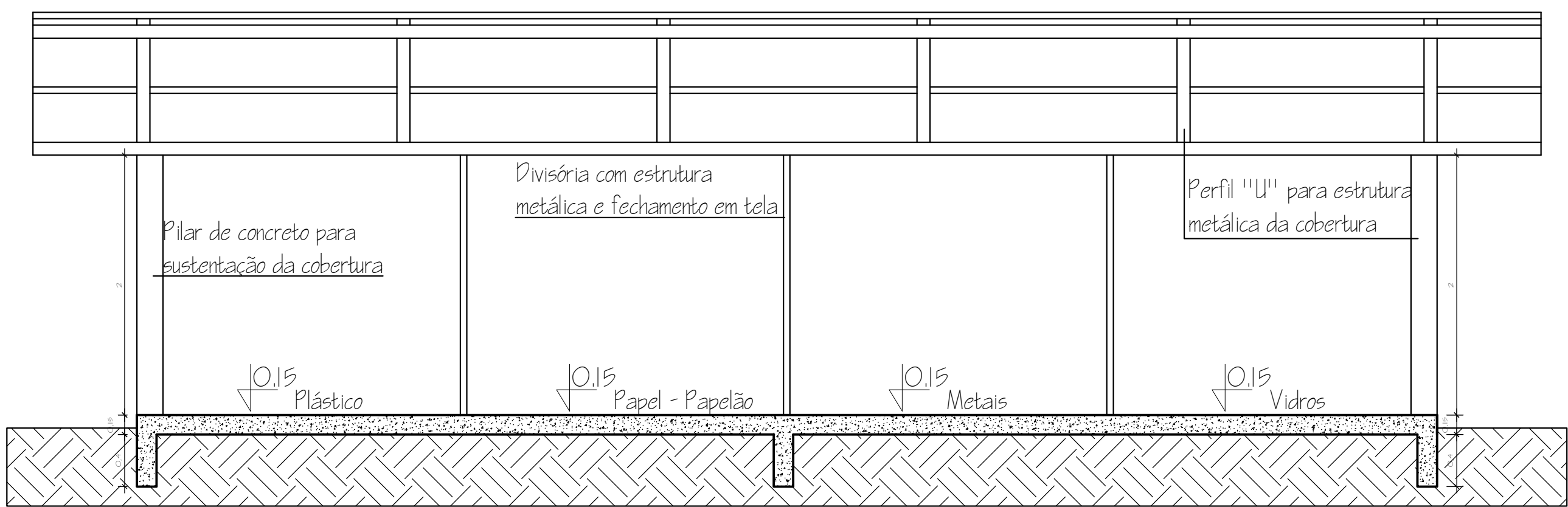
CORTE A - A' Esc: 1:50